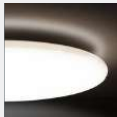
indirekter Lichtkranz up 10 % / down 90 %