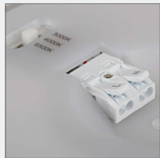
Farbwahlschalter 3.000 K | 4.000 K | 6.500 K