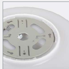
Deckenplatte aus Metall Befestigung mittels Bajonettverschluß