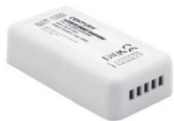
CTL SMA-AC RGBW