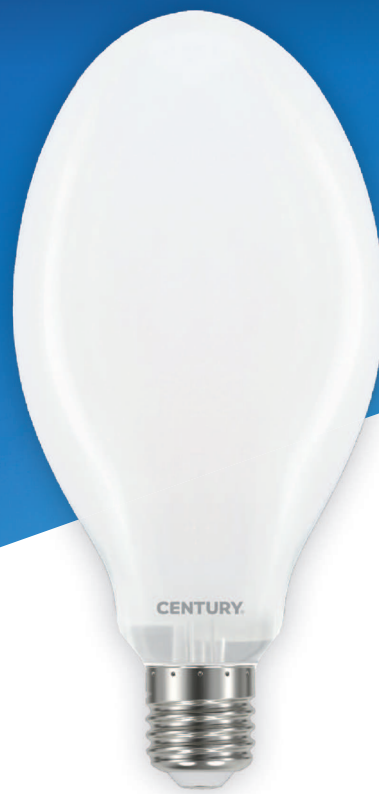
SAPS OPALE E27 - E40