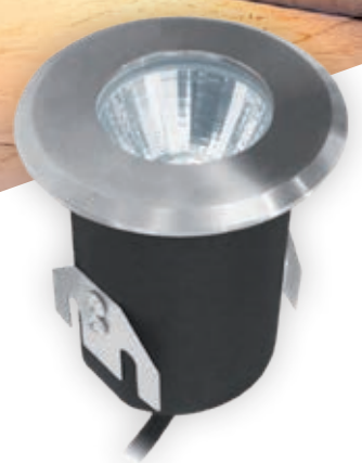
MP 1W ANCHE SOFFITTO