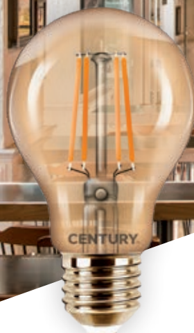
INVG3 GOCCIA E27